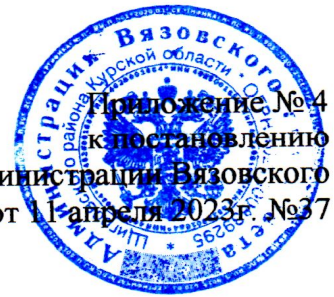
Схема оповещения и сбора личного состава ДПД при ликвидации пожаров и ЧС

Приложение № 4 к постановлению Администрации Вязовского сельсовета от 11-апреля 2023г. №37